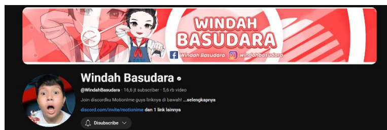
Gambar 2. Kanal YouTube Windah Basudara

Fenomena objektifikasi dalam The Inn-Sanity semakin problematis ketika disiarkan melalui kanal YouTube gaming populer. Windah, sebagai salah satu kreator konten gaming terpopuler di Indonesia dengan jutaan pengikut memiliki pengaruh besar dalam membentuk persepsi audiens. Dalam gameplay The Inn-Sanity yang ia mainkan, ditemukan sejumlah tindakan dan komentar yang mempertegas objektifikasi perempuan, mulai dari memposisikan kamera game untuk mengintip karakter perempuan hingga melontarkan komentar bernuansa seksual. Komentar penonton yang dibaca ulang oleh Windah pun memperkuat konstruksi perempuan sebagai objek visual semata. Dengan basis audiens yang sangat luas, konten seperti ini berpotensi menormalisasi praktik objektifikasi perempuan di ruang digital (Syahdan, 2022; Kristiyono & Hermawan, 2023).