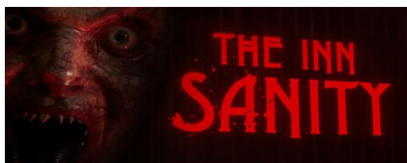
Gambar 1. Poster Game The Inn-Sanity

Fenomena objektifikasi dalam The Inn-Sanity semakin problematis ketika disiarkan melalui kanal YouTube gaming populer. Windah, sebagai salah satu kreator konten gaming terpopuler di Indonesia dengan jutaan pengikut memiliki pengaruh besar dalam membentuk persepsi audiens. Dalam gameplay The Inn-Sanity yang ia mainkan, ditemukan sejumlah tindakan dan komentar yang mempertegas objektifikasi perempuan, mulai dari memposisikan kamera game untuk mengintip karakter perempuan hingga melontarkan komentar bernuansa seksual. Komentar penonton yang dibaca ulang oleh Windah pun memperkuat konstruksi perempuan sebagai objek visual semata. Dengan basis audiens yang sangat luas, konten seperti ini berpotensi menormalisasi praktik objektifikasi perempuan di ruang digital (Syahdan, 2022; Kristiyono & Hermawan, 2023).